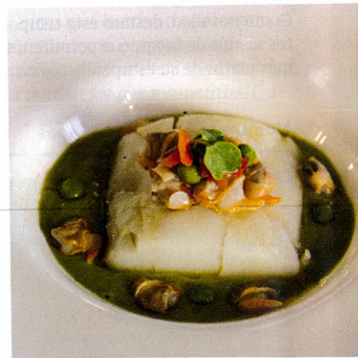
Bacalao a baja temperatura sobre crema fresca de guisantes y menta, con ajada de berberechos a la lima