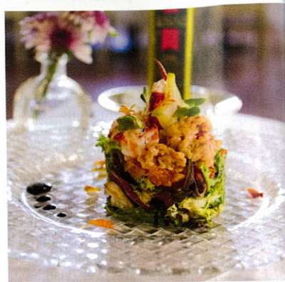
Ensalada de bogavante, dados de papaya, carambolo, langostinos escabechados y vinagreta de aguacate

La excelente materia prima es la principal credencial de la cocina de este establecimiento. Pescados frescos de Barbate, chuletones de larga maduración o naranjas ecológicas de producción propia son algunos ejemplos. Le recomendamos reservarse para probar nuestros postres caseros entre pinares e inmejorables vistas.